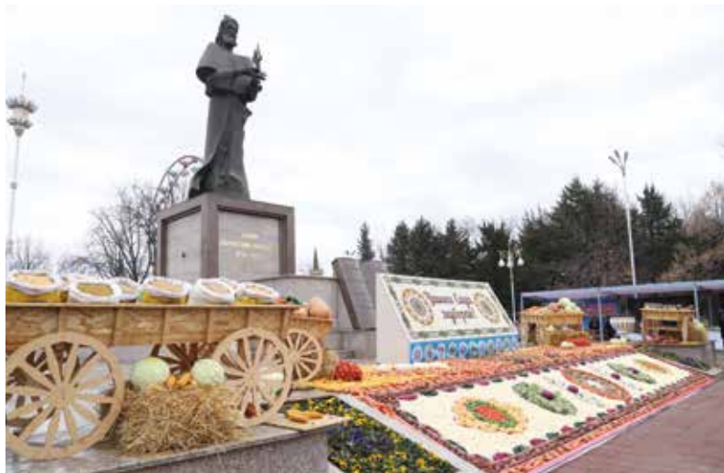
Сада ҷашни мулуки номдор аст, Зи Афредуну аз Ҷам ёдгор аст.

Имсол Тоҷикистон ҷашни Садаро, ки ба феҳристи ғайримоддии ЮНЕСКО ворид гардид, дар сатҳи ҷаҳонӣ бо шукӯҳу шаҳомати хос таҷлил менамояд.